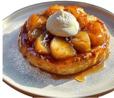
La tarte tatin