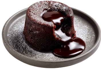
Le fondant au chocolat

Mais s'il n'y a pas de modèle universel, lequel est le plus adapté à votre projet ?